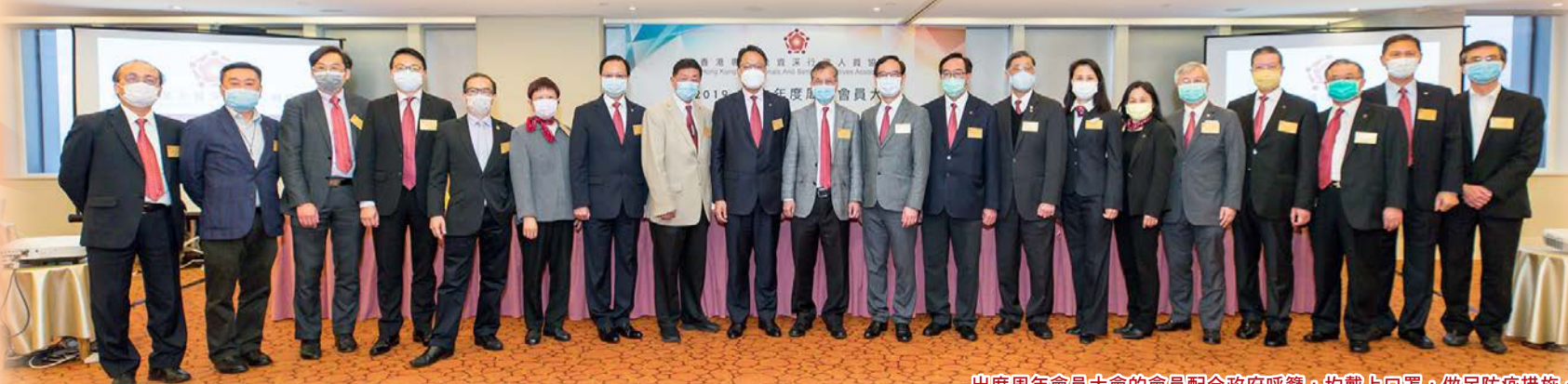
出席周年會員大會的會員配合政府呼籲，均戴上口罩，做足防疫措施。