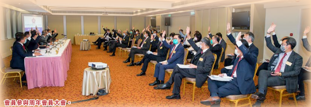
會員參與周年會員大會。