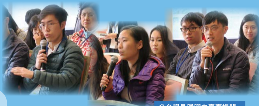
多名學員踴躍向嘉賓提問。