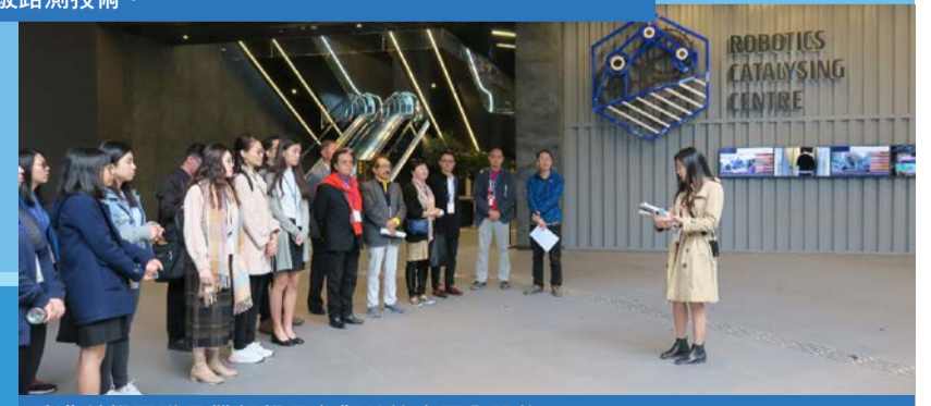
香港科學園職員帶領學員參觀並簡介園內設施。